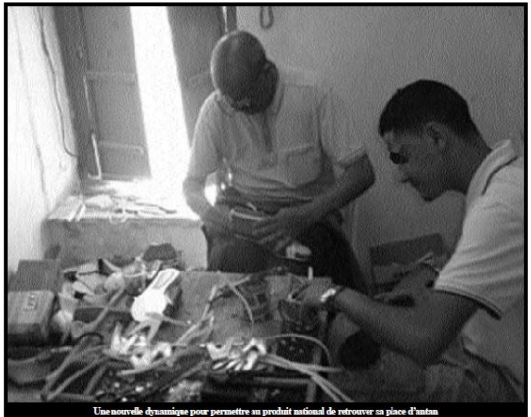
Une nouvelle dynamique pour permettre au produit national de retrouver sa place d'antan

Il a également souligné la mise en place de mécanismes d'aides et de soutien en mesure de freiner le déclin de cette activité et la mise en faillite inéluctable du noyau industriel traditionnel qui a pu résister à la concurrence déloyale des produits d'importation, a-t-il expliqué.